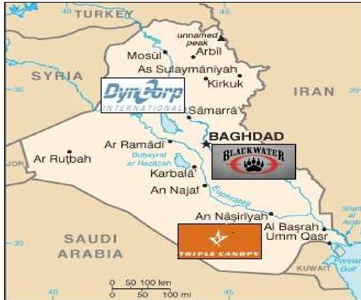
Figura 1: come si sono divise l'Iraq aree di competenza delle aziende di sicurezza privata (programma WPPS II)