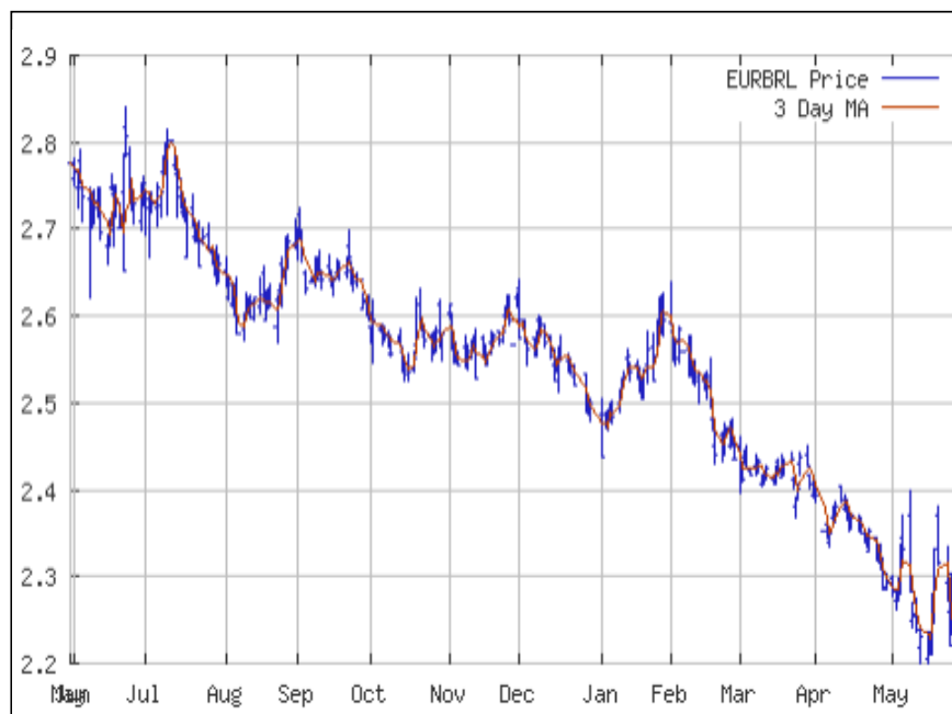
Cambio Euro / Real (ultimi 12 mesi)