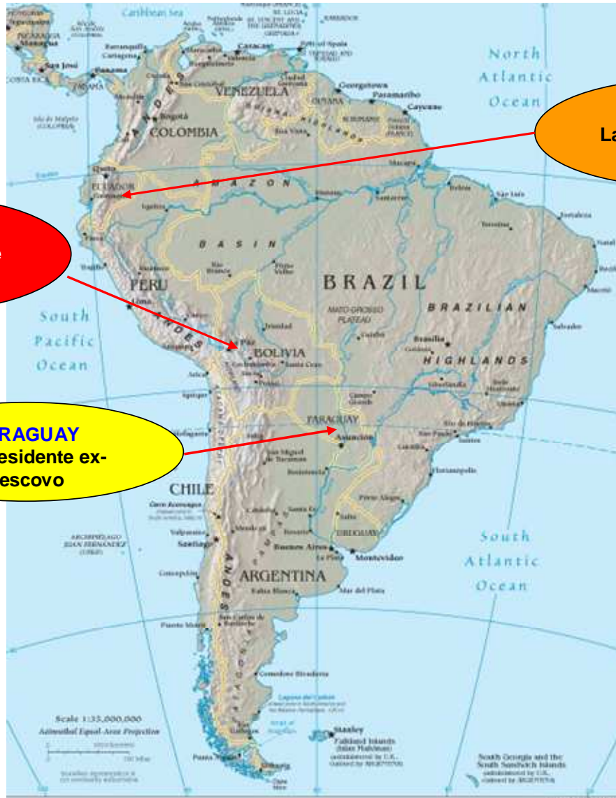
Figura 1 – Carta tematica – Il nuovo socialismo in America latina