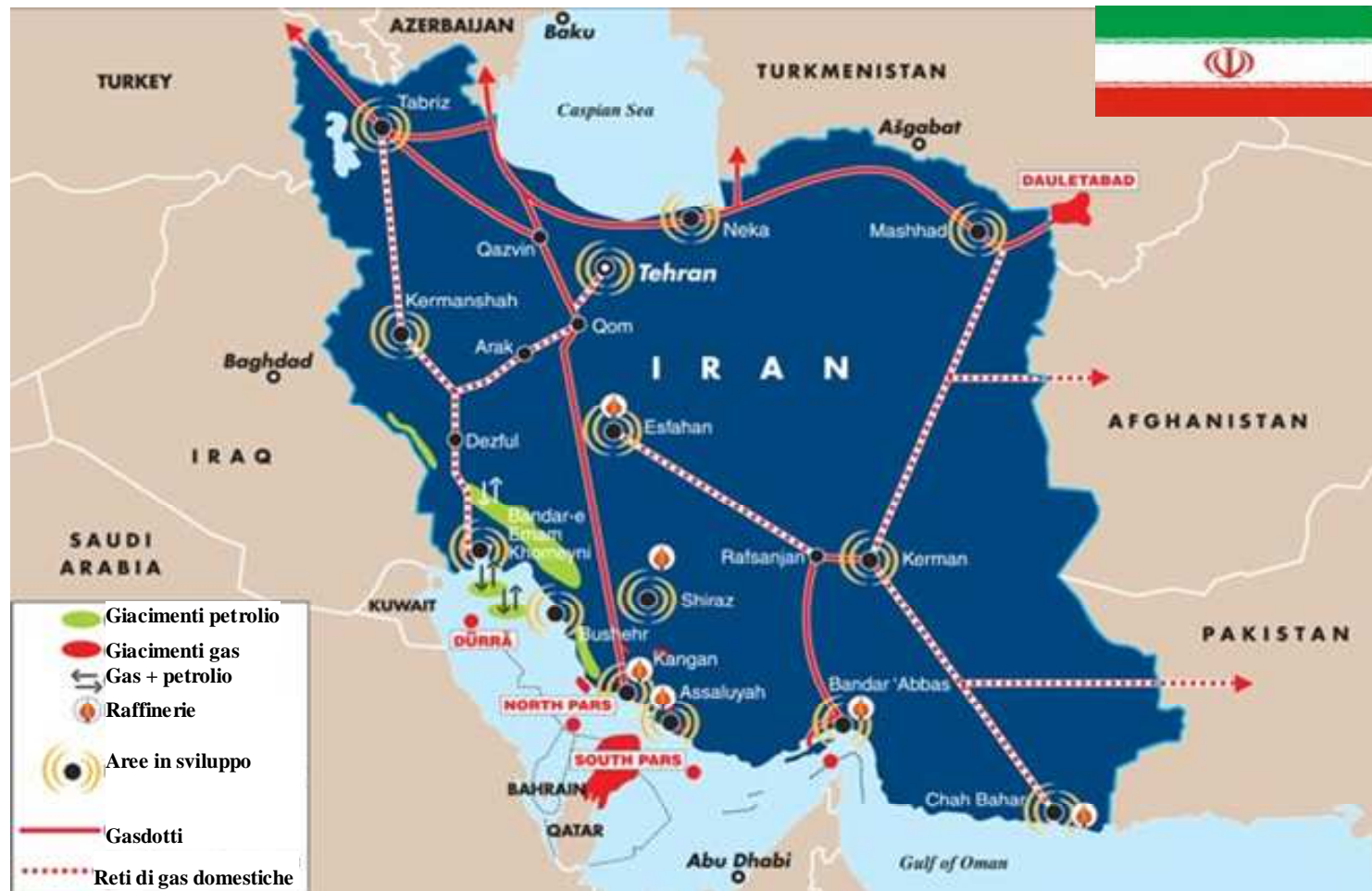
Figura 1 – La rete di gasdotti in Iran